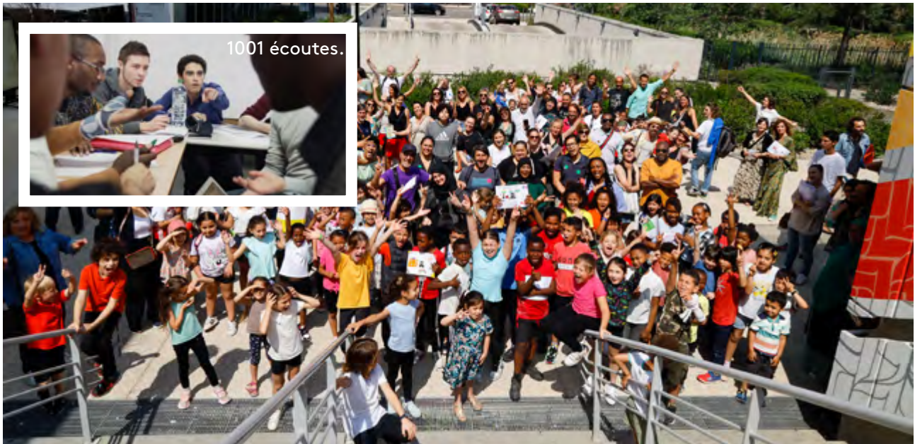
Le Grand bain.